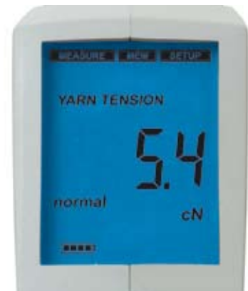
Tensão do fio