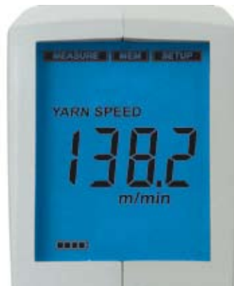
Velocidade do fio