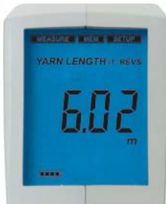
Consumo de fio